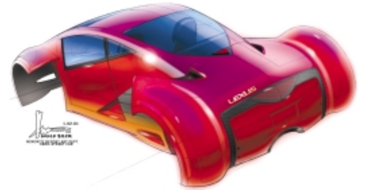
Der für "Minority Report" von der japanischen Marke Lexus unterstützten Sportwagenentwurf.