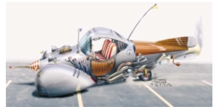
Fahrzeugentwürfe zu "Cat in the Hat" und "Inspector Gadget"