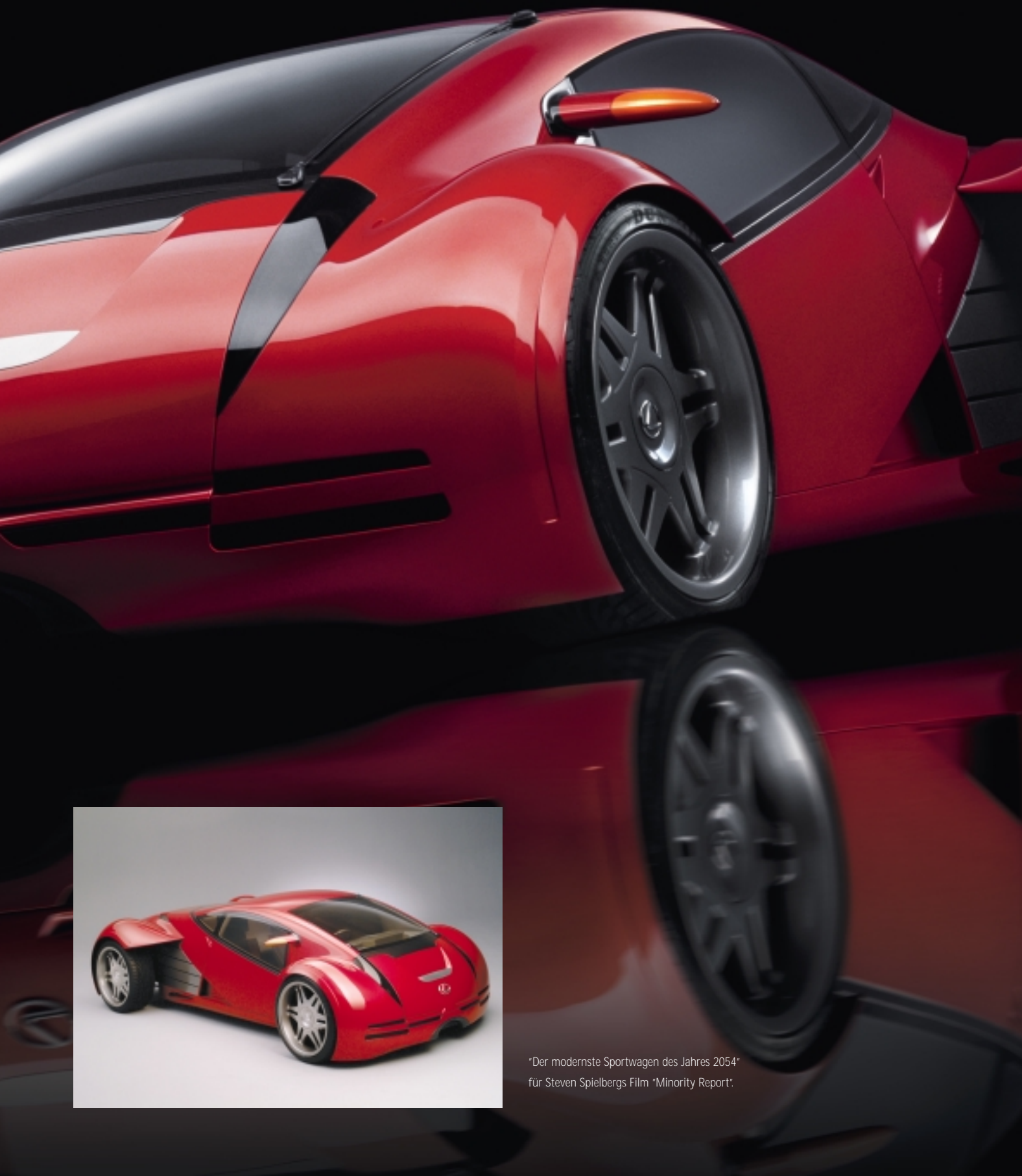
"Der modernste Sportwagen des Jahres 2054" für Steven Spielbergs Film "Minority Report".